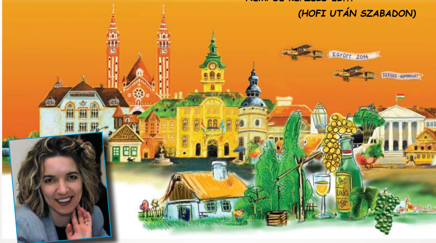
NÉMETHNÉ BÁTAYAI EDINA